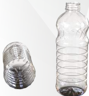
REF.:0417 GARRAFA 2 L

Peso: 38 a 44g Perfil: PCO28 ou PCO38 Embalagem: 72 un/fardo