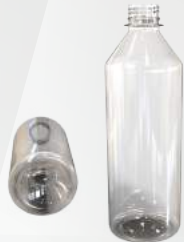
REF.:0403 GARRAFA 500 ML

Peso: 19g a 23g Perfil: PCO28 Embalagem: 147 un/fardo