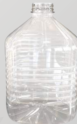
REF.:0512 GARRAFA 4 L

Peso: 76g Perfil: PCO38 ou PCO48 Embalagem: 36 un/fardo