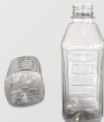
REF.:0517 GARRAFA 330 ML

Peso: 17g Perfil: PCO28 Embalagem: 171 un/fardo