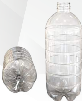
REF.:0208 GARRAFA 1,5 L

Peso: 40g Perfil: PCO38 Embalagem: 72 un/fardo