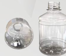
REF.:0404 GARRAFA 260 ML

Peso: 15a 18g Perfil: PCO28 Embalagem: 147 un/fardo