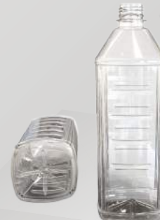
REF.:0518 GARRAFA 1L

Peso: 28 a 33g Perfil: PCO28 Embalagem: 112 un/fardo