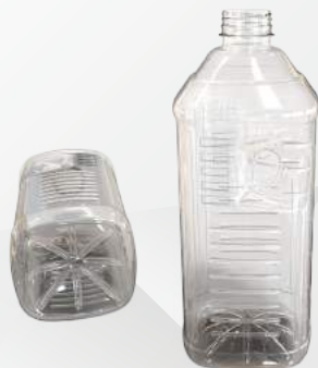
REF.:0509 GARRAFA 2 L

Peso: 40g Perfil: PCO38 Embalagem: 55 un/fardo