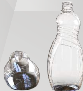
REF.:0414 GARRAFA 1L

Peso: 34g Perfil: PCO28 Embalagem: 90 un/fardo