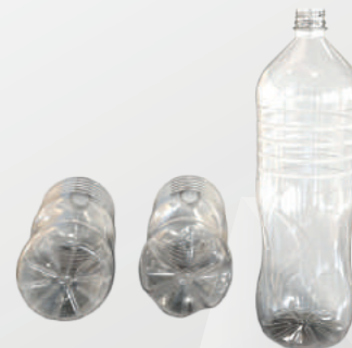
REF.:0102 GARRAFA 1,5 L

Peso: 28 a 48g Perfil: PCO28 Embalagem: 78 un/fardo