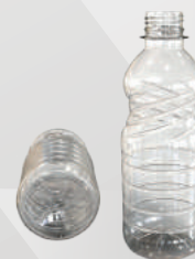
REF.:0104 GARRAFA 330 ML

Peso: 13 a 15g Perfil: PCO28 Embalagem: 207 un/fardo