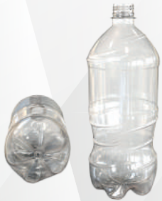
REF.:0119 GARRAFA 1 L

Peso: 28g Perfil: PCO28 Embalagem: 105 un/fardo Opções: