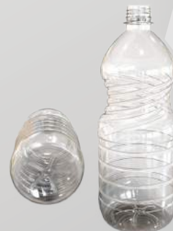
REF.:0106 GARRAFA 1L

Peso: 29g Perfil: PCO28 Embalagem: 90 un/Fardo