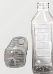
REF.:0502 GARRAFA 900 ML

Peso: 28 g Perfil: PCO38 Embalagem: 112 un/fardo