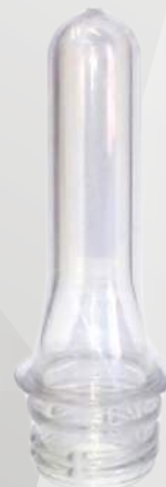
REF 0002 PREFORMA 16,5g