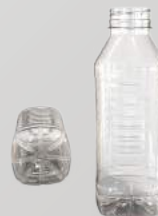
REF.:0506 GARRAFA 500ML

Peso: 17g Perfil: PCO38 Embalagem: 171 un/fardo