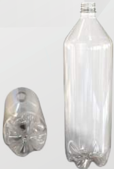
REF.:0121 GARRAFA 1,5L

Peso: 29 a 46g Perfil: PCO28 Embalagem: 66 un/fardo Opções: