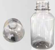
REF.:0401 GARRAFA 100 ML

Peso: 13g Perfil: PCO28 Embalagem: 500 un/fardo