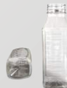
REF.:0504 GARRAFA 330 ML

Peso: 17g Perfil: PCO38 Embalagem: 220 un/fardo