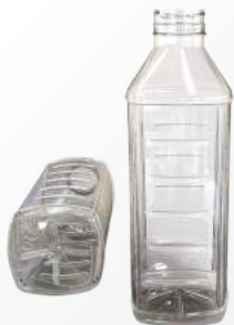
REF.:0507 GARRAFA 1 L

Peso: 28 a 33g Perfil: PCO38 Embalagem: 112 un/fardo