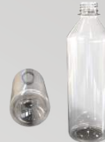
REF.:0402 GARRAFA 250 ML

Peso: 13g Perfil: PCO28 Embalagem: 198 un/fardo