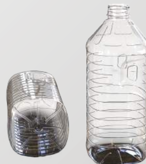
REF.:0510 GARRAFA 2 L

Peso: 40g Perfil: PCO38 Embalagem: 55 un/fardo