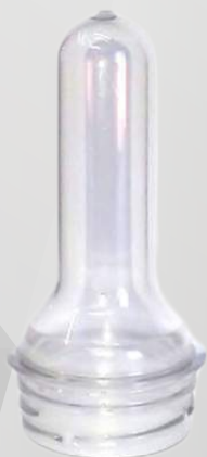
REF 0001 PREFORMA 17g