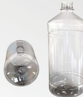
REF.:0406 GARRAFA 1 L

Peso: 29 a 48 g Perfil: PCO28 Embalagem: 96 un/fardo