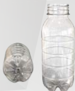
REF.:0206 GARRAFA 300 ML

Peso: 17g Perfil: PCO38 Embalagem: 220 un/fardo