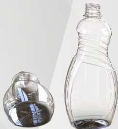
REF.:0413 GARRAFA 500 ML

Peso: 23 a 29g Perfil: PCO28 Embalagem: 138 un/fardo