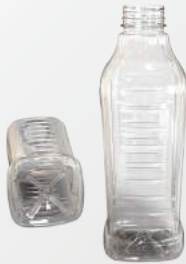
REF.:0515 GARRAFA 900 ML

Peso: 28g Perfil: PCO38 Embalagem: 105 un/fardo