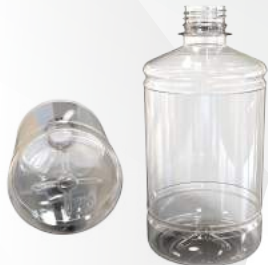
REF.:0405 GARRAFA 500 ML

Peso: 23g Perfil: PCO28 Embalagem: 128 un/fardo