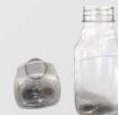
REF.:0508 GARRAFA 200 ML

Peso: 17g Perfil: PCO38 Embalagem: 240 un/fardo