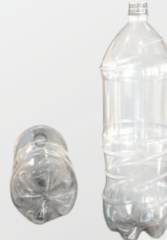
REF.:0120 GARRAFA 2 L

Peso: 46g Perfil: PCO28 Embalagem: 78 un/fardo Opções: