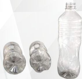
REF.:0101 GARRAFA 510 ML

Peso: 15 a 23g Perfil: PCO28 Embalagem: 162 un/fardo