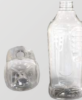
REF.:0516 GARRAFA 1,8 L

Peso: 40g Perfil: PCO38 Embalagem: 55 un/fardo