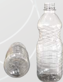
REF.:0105 GARRAFA 500 ML

Peso: 15 a 18g Perfil: PCO28 Embalagem: 180 un/fardo