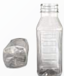
REF.:0501 GARRAFA 300 ML

Peso: 17g Perfil: PCO38 Embalagem: 220 un/fardo