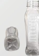
REF.:0514 GARRAFA 500 ML

Peso: 17g Perfil: PCO38 Embalagem: 162 un/fardo