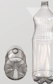
REF.:0122 GARRAFA 2 L

Peso: 46g Perfil: PCO28 Embalagem: 78 un/fardo Opções: