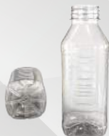
REF.:0505 GARRAFA 450ML

Peso: 17g Perfil: PCO38 Embalagem: 171 un/fardo