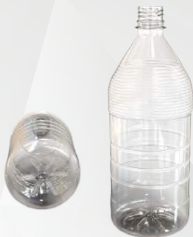
REF.:0415 GARRAFA 900ML E 1L

Peso: 29g Perfil: PCO28 Embalagem: 112 un/fardo