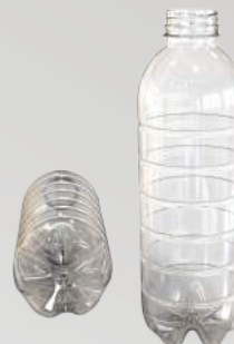
REF.:0207 GARRAFA 900 ML

Peso: 28g Perfil: PCO38 Embalagem: 112 un/fardo