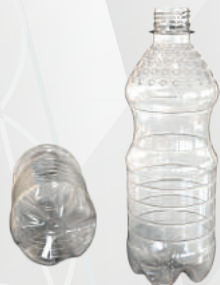
REF.:0103 GARRAFA 510 ML

Peso: 15 a 23g Perfil: PCO28 Embalagem: 162 un/fardo