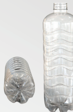
REF.:0209 GARRAFA 1,7 L

Peso: 40g Perfil: PCO38 Embalagem: 72 un/fardo