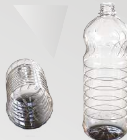
REF.:0416 GARRAFA 1L

Peso: 29 a 33g Perfil: PCO28 ou PCO38 Embalagem: 112 un/fardo