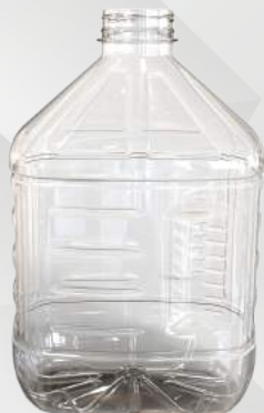
REF.:0511 GARRAFA 3 L

Peso: 76g Perfil: PCO38 ou PCO48 Embalagem: 36 un/fardo