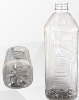
REF.:0503 GARRAFA 1,7 L

Peso: 40 a 44 g Perfil: PCO38 Embalagem: 66 un/fardo